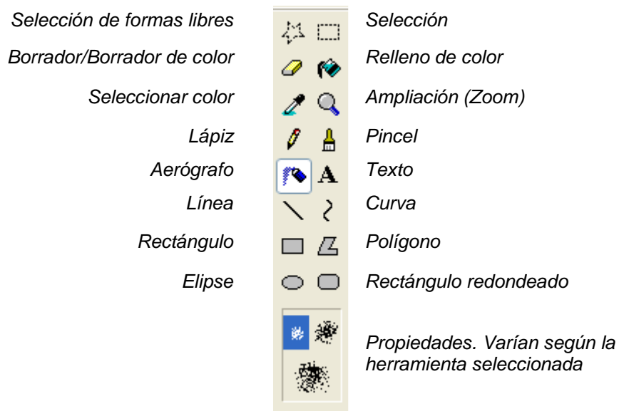
Caja de herramientas del Paint

La siguiente figura muestra las distintas herramientas que posee el Paint: